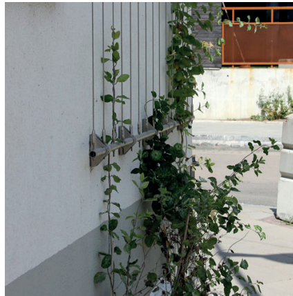
Mehrfachseilführung mit langem Tragrohr für breite Begrünungen