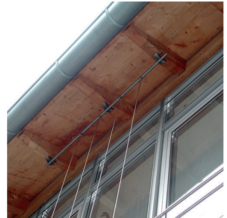
Halterbefestigungen an Holzsparrn für Sonnenschutz mit Kletterpflanzen