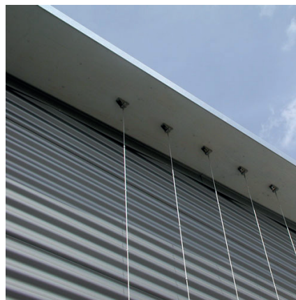
Halterbestigung an Dachuntersicht