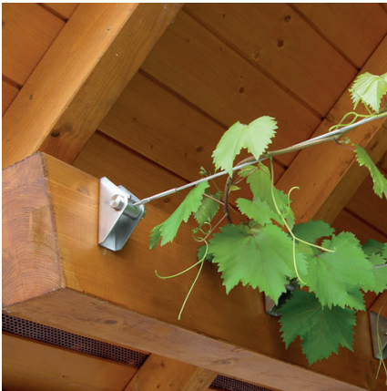
Edelstahlseil horizontal für eine Weinrebe

Strukturen und Technik für Kletterpflanzen